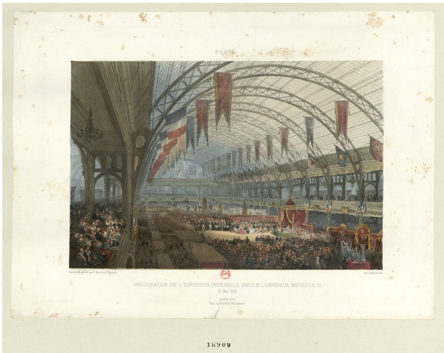
Fig. 3. L'imperatore Napoleone III inaugura l'Esposizione Universale a Parigi il 15 maggio 1855. Jules Arnot, Inauguration de l'Exposition universelle par S. M. l'empereur Napoléon III, Guérard, lithographe, éditeur Goupil et Cie, Paris in Recueil. Collection de Vinck. Un siècle d'histoire de France par l'estampe (1770-1870), vol. 157 (pièces 18825-18945), Second Empire [De Vinck, 18909].