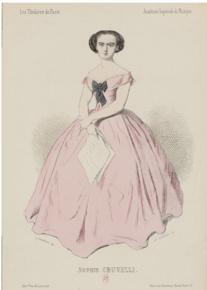
Fig. 4. Sophie Cruvelli nel 1855 all'Académie Impériale de Musique (Opéra). Alexandre Collette (d'après E. Lempsanius), Sophia Charlotte Crüwell dite Cruvelli , 1 estampe, lithographié à la plume (19 x 15 cm), Prodhomme, Paris, 1855, ensemble musicale IconMUSI.