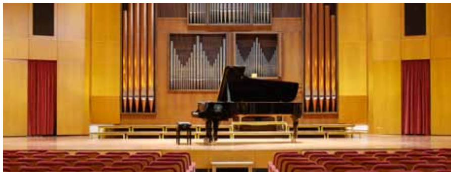
Auditorium Michelangeli del Conservatorio di Bolzano