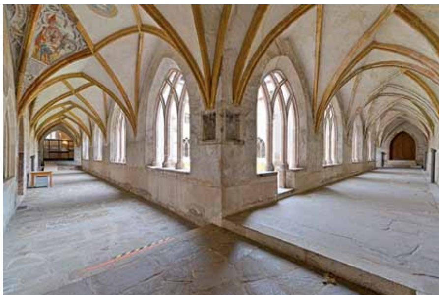
Chiostro dei Domenicani

Presidente della Società Italiana di Musicologia