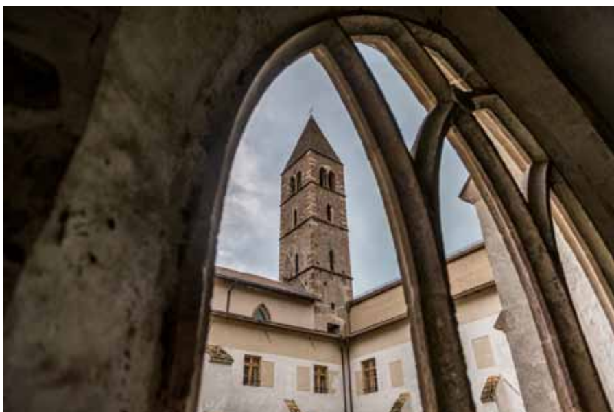
Ex-Convento dei Domenicani, ora sede del Conservatorio di Bolzano